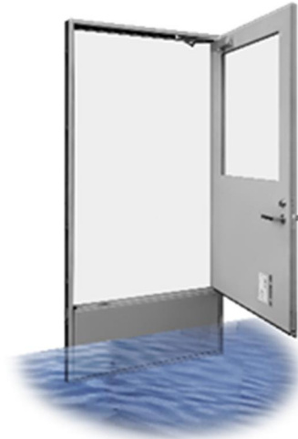
避難扉開放状態（災害時）

従来の TS ウォータータイトに加えて、さらに「災害対策に人手と手間をかけないものがあれば」との要望に応えるべく、『TS ウォータータイト避難可能タイプ』を開発いたしました。いつもは通常ドアと同じ使い勝手で、災害時は浸水しても避難ができるため水防板の設置等が不要になります。いつ発生するかわからない自然災害に対し特に意識することなく常に備えができる防災商品です。