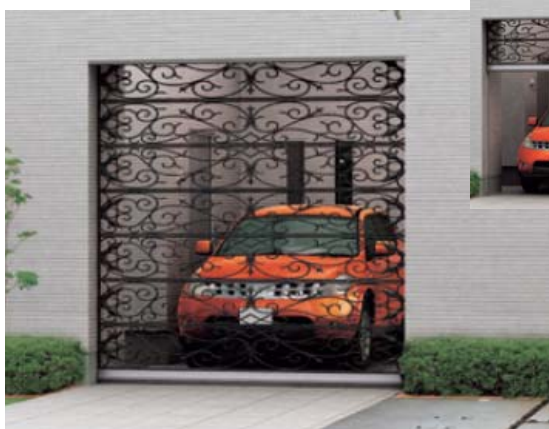
ロートアイアンシャッター

アーキテリアシャッターの総販売元はスガツネ工業株式会社、製造・施工・保守を東洋シャッター株式会社が担当し、平成 20 年 11 月 17 日より全国一斉販売を開始いたします。