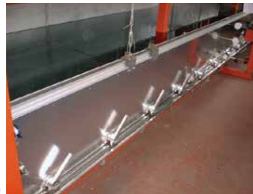
吊下げ式アルミ水防板の止水性能試験